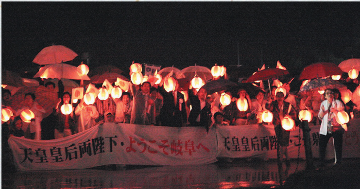
岐阜グランドホテル前の河岸で、提灯で奉迎する岐阜県民