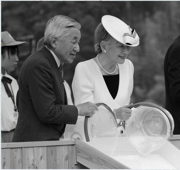
長良川に、稚魚を御放流になる両陛下